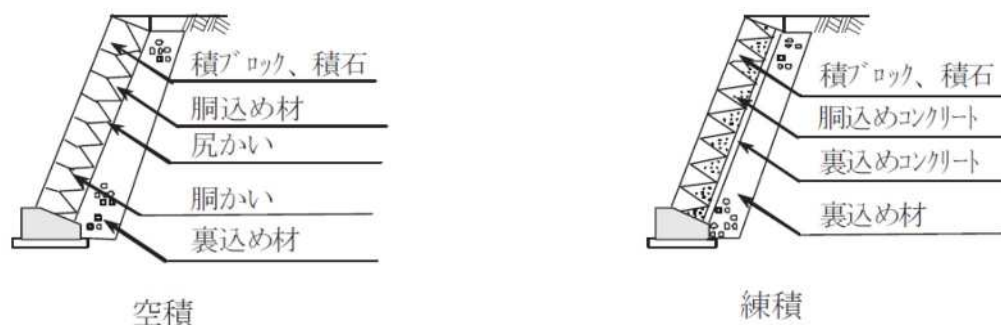
図3-5-1 コンクリートブロック工 標準断面図