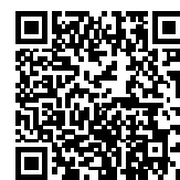
▲省エネ通知のページQRコード