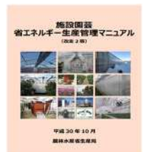
▲省エネマニュアル