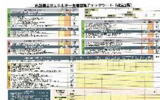
▲省エネチェックシート