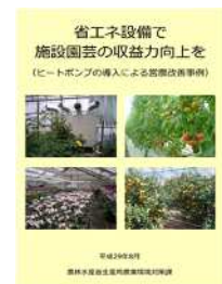
▲省エネで収益力向上を