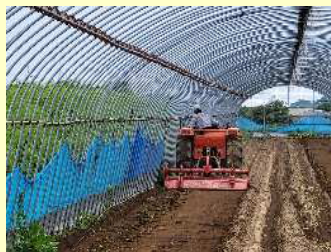
地温の高い時期に 複数回 耕うんして分解促進