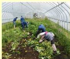
残さを苗床の外へ持ち出す