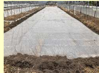
バスアミド微粒剤等を土壌混和した後、ビニールで 全面被覆