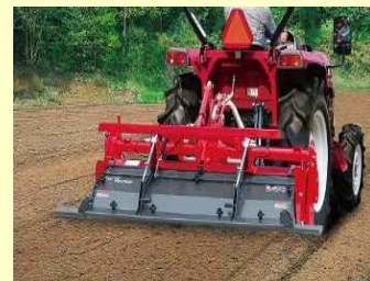
ロータリーで 複数回 耕うんして分解促進