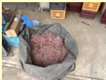
残さを集めてほ場の外へ持ち出す