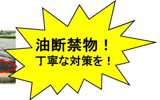
③ 枕畝を設置しない