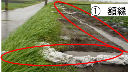
① 額縁明きよの施工

基腐病菌は水を介して移動するため、水が溜まりやすいほ場で感染株が増加します。感染してからでは被害を抑えることが難しくなるため、以下の3つの作業を行い、ほ場に水が溜まらないようにしましょう。