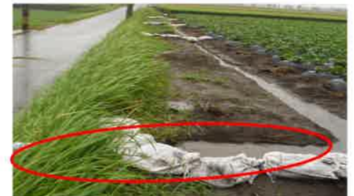
③ 明きよを排水路に接続