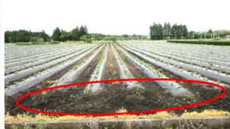
② 枕畝を設置しない