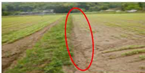
① 額縁明きよの施工

基腐病菌は水を介して移動するため、水が溜まりやすいほ場で感染株が増加します。排水口があっても、ほ場外への接続が悪い場合は、表面排水が不十分になるため、以下の3つの作業を行いましょう。