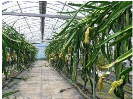
ピタヤ(ドラゴンフルーツ)の園地

みずみずしく、後味はすっきりとした味覚のピタヤ(ドラゴンフルーツ)！ 栽培期間中は農薬は使用せず、安心・安全な果実です！ また、果実には、美容を気にする方にうれしい、食物繊維、カリウム、マグネシウム、 葉酸が含まれます。