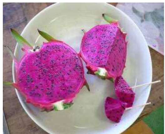
さわやかな甘さと風味がトロピカル