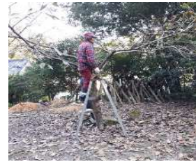
低樹高化実習風景（果実を全て収穫し残さないため。）