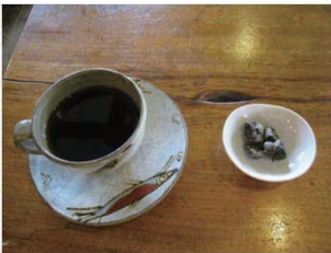
徳之島コーヒー (珈琲スマイル)