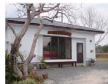
農家民宿 「幸ちゃん家」