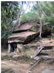
天女ヶ倉神社のご神体