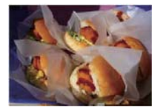
“幻”のコロッケバーガー