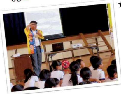
★御楼門の大きさにびっくり!