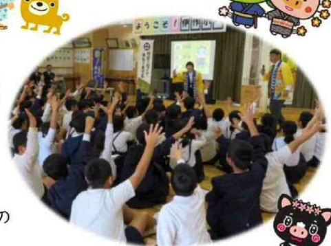
★「日新公いろはかるた」取りの様子を見せてくれました。