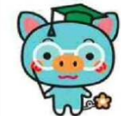
伊作小学校 5,6年生 のみなさん