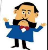
★薩摩藩英国留学生記念館 で実施しました！