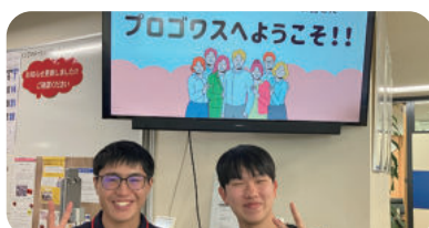
●素敵なお出迎えをいただきました。嬉しかったです。