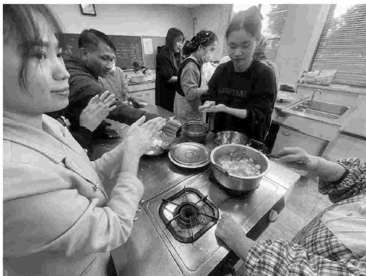
お互いの国の料理の作り方を教え合う