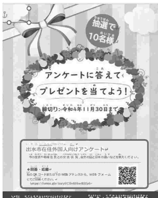
在住外国人向けアンケート調査チラシ（出水市）