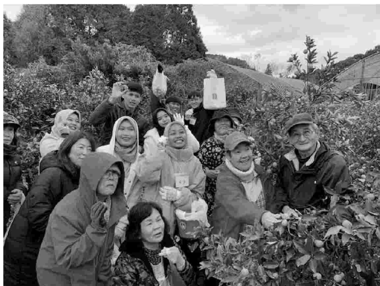
S L A と万世地区サロンとの金柑取り（津貫にて）