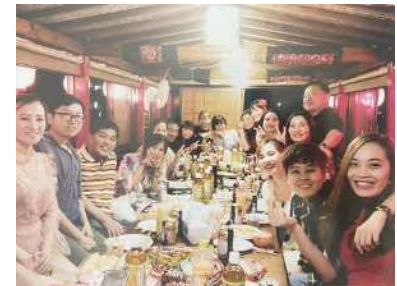
江津湖の花火大会を屋形船で観覧