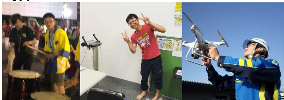
社内外のイベント参加風景