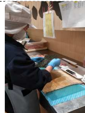
惣菜部門実習生の作業様子