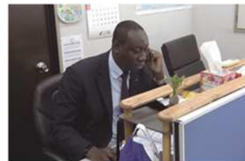
海外営業担当の様子