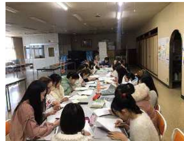
月に1回開かれる日本語勉強会