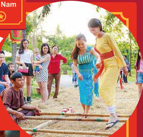
Nhảy sạp.(múa tre)