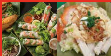
Ẩm thực Việt Nam