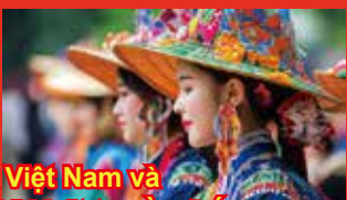
Múa Việt Nam và các bài hát truyền thống