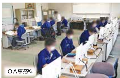
O A 事務科