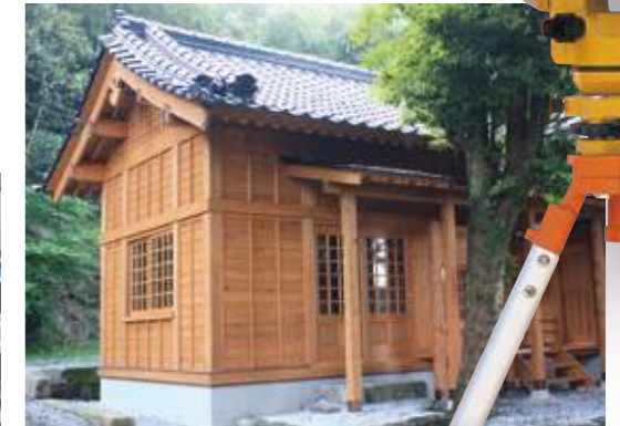
施工現場実習で手掛けた神社社務所