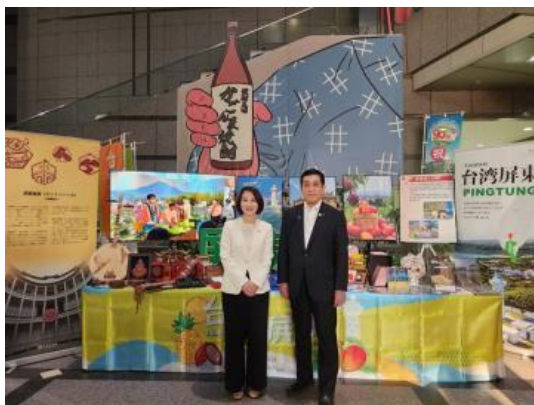
● 핑둥현 지사와

또한 간담 후 저녁식사에서는 아마미의 섬노래의 연주나 가고시마의 식재료를 사용한 요리 등 「남쪽의 보물상자 가고시마」 를 한껏 즐겨주셨습니다.