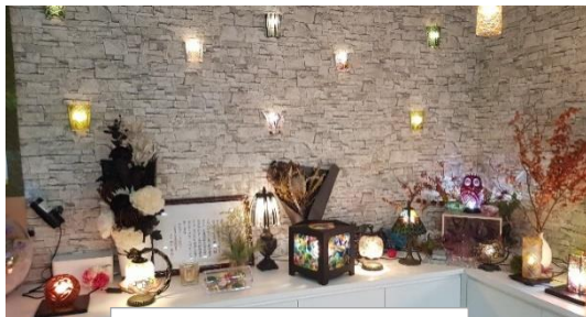
데시마루 공방의 내부

니다. 술잔 이외에도 스테인드 글라스나 섬세한 액세서리 등 현대식으로 재해석 된 작품도 많이 있습니다. 그 재해석의 하나로 사츠마 키리코의 데시마루 공방에서는 사츠마 키