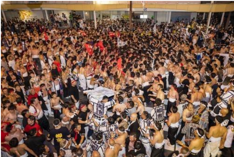
●당일 행사의 모습

사츠마 센다이시의 전통행사인 센다이 줄다리기가 개최되었습니다. 길이 365m, 무게 약 7 톤으로 일본에서 제일 큰 줄을 사용하고 있으며 420 년 이상 이어져 온 전통행사입니다. 2024 년 3 월에는 국가 중요 무형 민속 문화재에도 지정되었습니다. 당일에는 상반신을 탈의하고 사라시를 두른 「하다카」라고 부르는 3 천명의 남성들이 줄다리를 하였습니다.