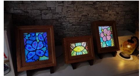
스테인드글라스 사츠마 키리코