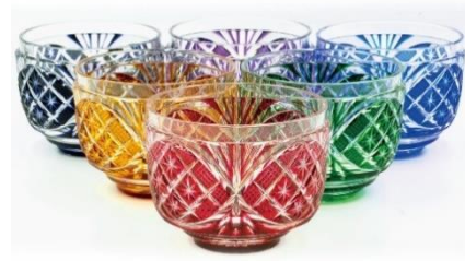
사츠마 키리코 컵

사츠마번의 유리 제작은 1846 년에 시작되었습니다. 그리고 28 대 시마즈 나리아키라가 번주가 되면서 비약적인 발전을 이루었고 「사츠마 키리코」가 탄생하였습니다. 그러나 당주가 사