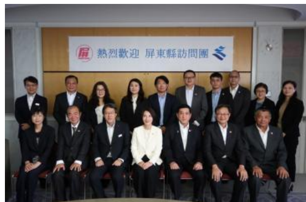
● 핑둥현 일행여러분들과