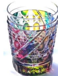
하이볼 잔 (제공 : 데시마루 공방)