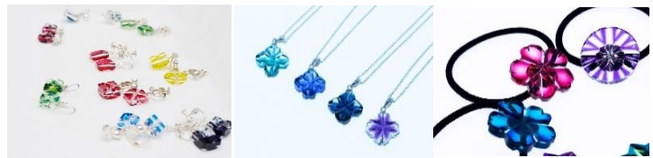
체험 샘플

저는 그 체험에 참가하여 선생님의 정성스러운 지도 아래 나만의 오리지널 키리코 액세서리를