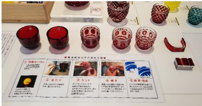
사츠마 키리코 제작 과정

망하고 생산이 중지되었으며 일본도 혼란의 시대가 되었습니다. 그리고 100 년 후 많은 장인과 전문가의 노력으로 사츠마 키리코가 부활할 수 있었습니다.