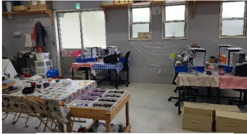
키리코 사츠마 커트 체험 코너

리코의 제조 과정에서 남는 유리로 자신의 액세서리를 만드는 체험 등 다양한 체험을 하는 것이 가능합니다.