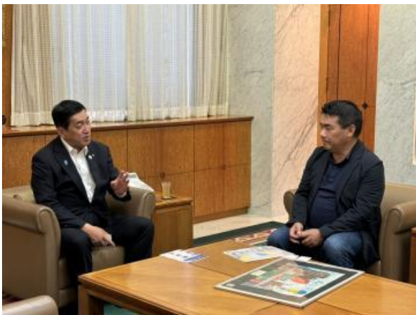
●이야기를 나누는 모습

우크라이나에서 피난 온 아이들이 고향을 생각하며 그린 그림을 가고시마현민 여러분이 보시고 우크라이나의 참상을 잊지 말아달라는 이야기를 하셨습니다.