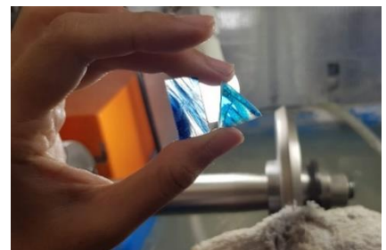
완성! 연습작과 완성작

사츠마 키리코 데시마루 컷트 공예, 상점 https://deshimaru.jp/