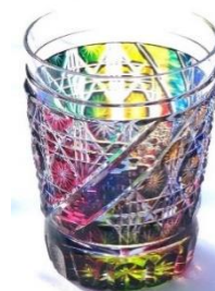
冰威士忌苏打彩云