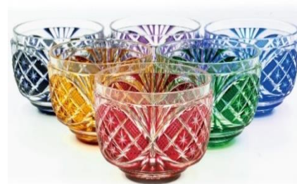
萨摩切子小钵

但是，当家之主的去世导致了生产的停滞，日本全体陷入了混乱的时代。此后的100年，经过很多匠人和专家的努力，萨摩切子再次复活。