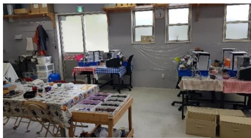
萨摩切子切削体验一角