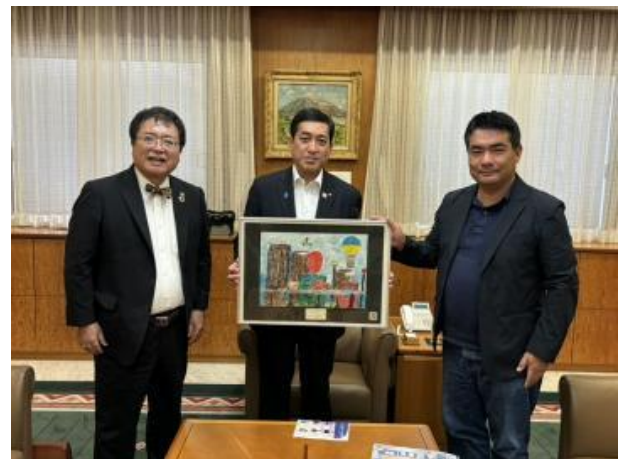
●与兵头博校长、村上理事长