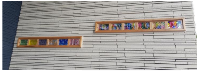
弟子丸工房外墙装饰

在这里可以各种体验，比如可以体验使用萨摩切子弟子丸工房制造萨摩切子产生的边角料为自己制作首饰等。