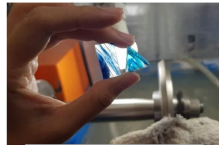
完成！练手的和正式的两份