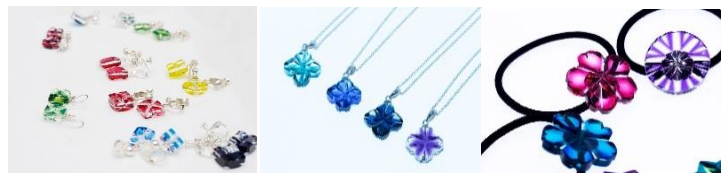
体验样品