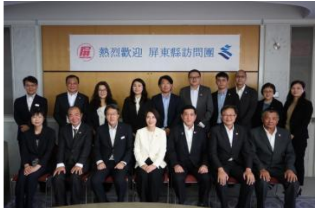
●与屏东县一行人员