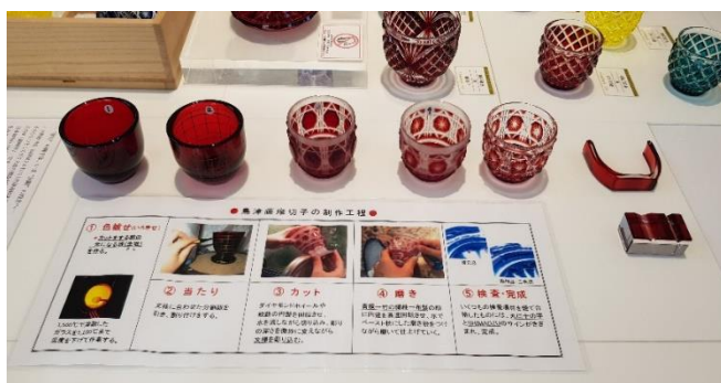
萨摩切子的制作过程