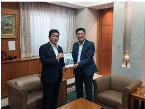
●与文冈赛鲁吉奥正树

知事表示，今后也会在此前构筑的交流的基础上，进一步发展及与巴西鹿儿岛县人会的交流与协作关系。