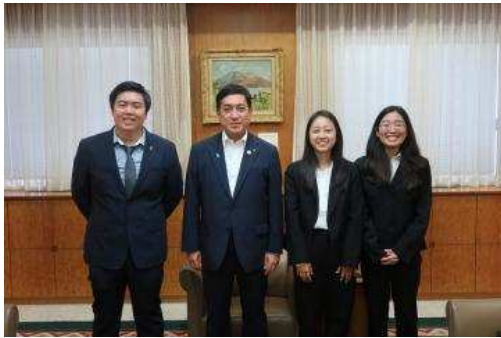
●与 3 名县费留学生

县费留学生项目，是本县接受本县移民人士的子女，鼓励其在鹿儿岛勤学，回国后作为与本县的友好桥梁，为促进相互间的经济·文化交流做出贡献的项目。该项目于昭和 45 年开启后至今已接受了 148 名。县费留学生们表示，想更加努力地学习日语，更加充实地度过在大学的学习，和在鹿儿岛的生活。知事表示，除了勤奋学习，还希望他们能好好品尝鹿儿岛美味的食材和烧酒，回国后也能广泛宣传鹿儿岛的美好之处。