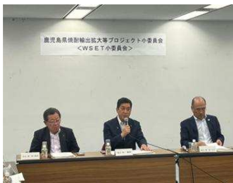
●委员会发言的样子

本县一直保持国家与本县酿酒组合相关人员的紧密协作，战略性开展进一步扩大在世界范围享有盛誉的“正统烧酒”出口的举措。