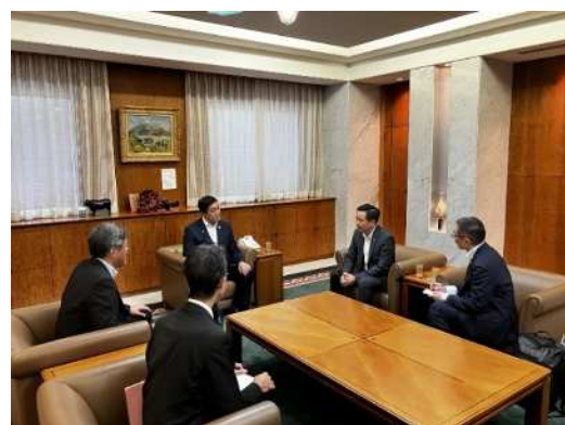
●意见交换会的样子