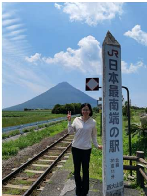
与中国上海同纬度的西大山站