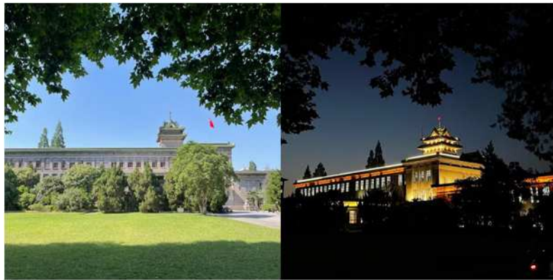
中国供职单位的南京农业大学

在鹿儿岛的时光，一晃就过去了3个月。就像日本谚语「すめば，みやこ」（“久居为安”）所言，多亏有各位亲切相待，我很快地习惯了在鹿儿岛的生活和工作。即便没有特别的活动很淡然的每一天，我也觉得很享受。往后的日子，也一定各种学习，努力工作，享受生活。请大家多多关照。