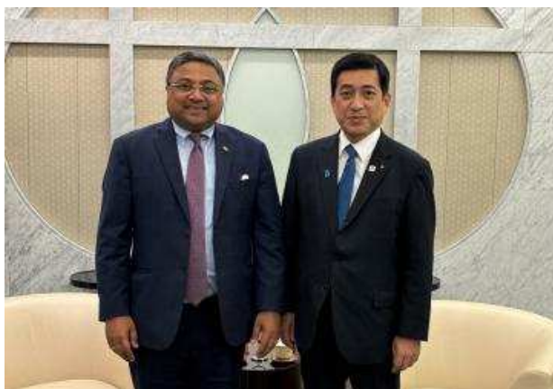
●和西比·乔治大使的合影