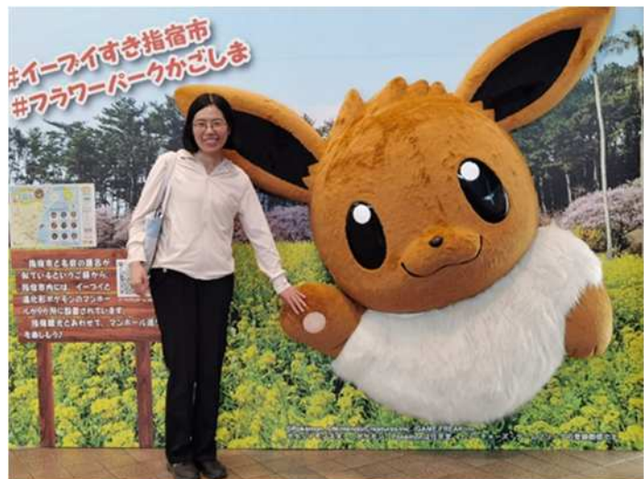
位于指宿市的 Flower Park Kagoshima