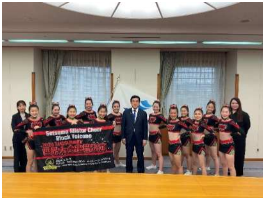
知事と SATSUMA ALL STAR CHEER の皆さん

今後もより一層練習に励み、これから始まる世界大会では目標に向かって、活躍してくれることを期待しています。