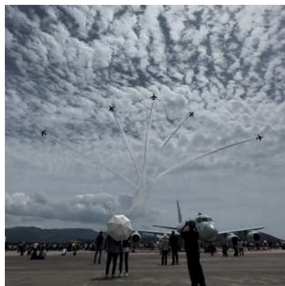
6機で見事な編隊飛行を行う ブルーインパルス

令和6年4月28日（日）鹿屋市海上自衛隊航空基地で行われました。10年ぶりとなるブルーインパルス Blue Impulse の航空ショーや普段見ることのできない航空機等の地上展示も行われ、実行委員によると来場者は4万人を越える大盛況で会場は大いに盛り上がりました。