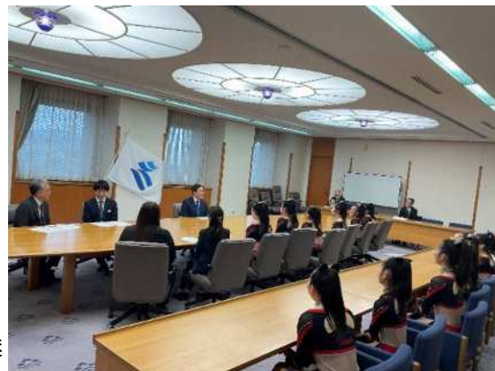
知事からの激励の言葉