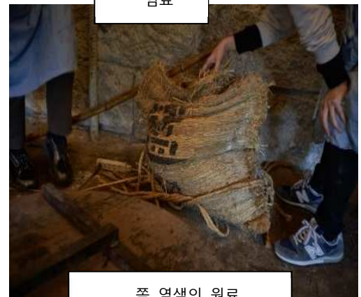
쪽 염색의 원료