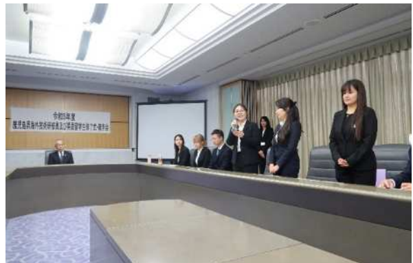
◀인사하는 해외 기술연구원들.