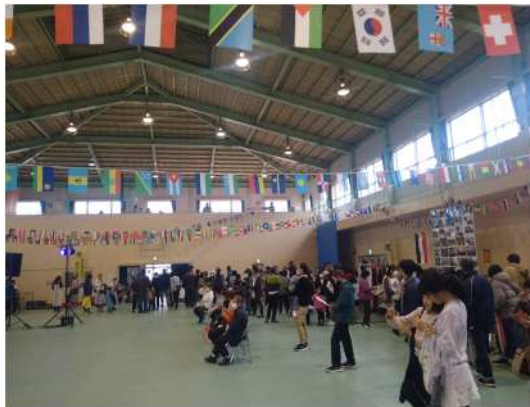
▲ 체육관에 모인 참가자들