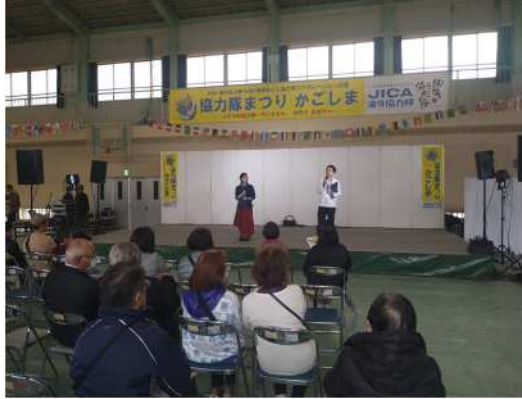
▲ 무대 이벤트

● <협력대 축제 가고시마 2024>가 개최되었습니다. (3 월 17 일) ●