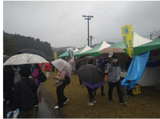
▲ 지역 부흥 협력대의 부스