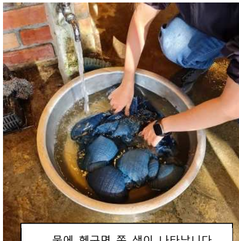
물에 헹구면 쪽 색이 나타납니다

초록색이었습니다. 원하는 색이 되면 천을 물에 헹구고 탈수하여 건조합니다. 그러면 기다리던 아름다운 쪽 색이 눈 앞에 나타납니다.