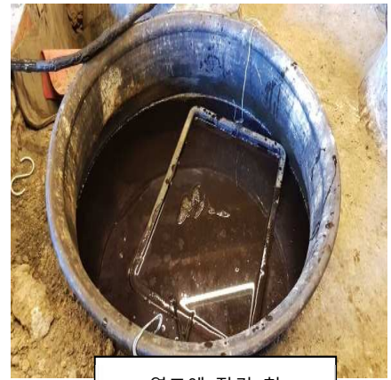
염료에 잠긴 천

초록색이었습니다. 원하는 색이 되면 천을 물에 헹구고 탈수하여 건조합니다. 그러면 기다리던 아름다운 쪽 색이 눈 앞에 나타납니다.