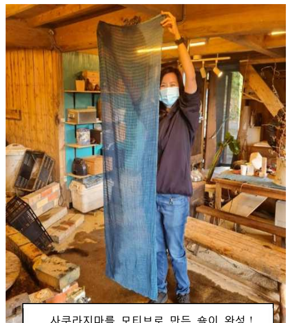
사쿠라지마를 모티브로 만든 솔이 완성!

저는 손으로 무언갈 만드는 것을 좋아해서 이번 기회로 일본의 전통 공예 쪽 염색에 대해 배울 수 있어 좋았습니다. 선생님 덕분에 즐거운 체험을 할 수 있었고, 쪽 염색에 대해 많은 것을 배울 수 있었습니다. 실제로 체험해 보니 천연 재료를 염색액으로 만드는 공정뿐만 아니라 쪽의 관리 등 쪽 염색에는 엄청난 정성이 들어간다는 알 수 있었습니다. 쪽 염색은 그야말로 사랑의 힘이 필요한 것이죠!