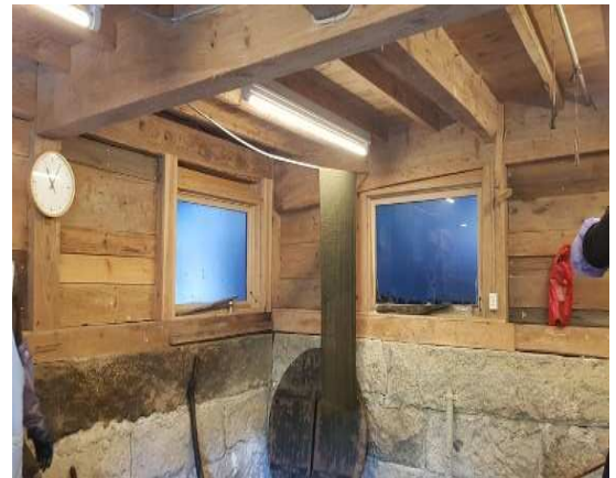
자연 건조 중인 짙은 녹색의 천