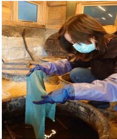
천을 염료에 담그는 모습

저는 솔을 단소메(段染め)기법으로 염색하기 위해 먼저 천을 전체적으로 물들이고 조금씩 구역을 나눠 묶은 후 몇 번에 걸쳐 천을 염료에 담그는 작업을 했습니다. 이 작업을 반복하면 천에 공기가 닿으면서 점차 원하는 색이 나오게 됩니다. 작업이 끝났을 때 천의 색은 파란색이라기 보다는 짙은