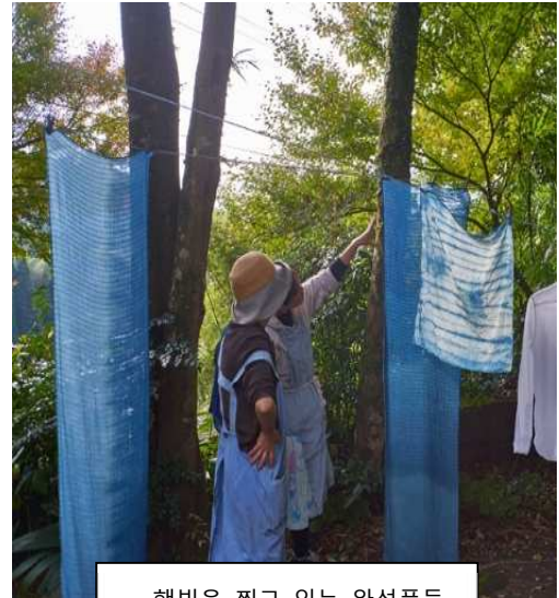
햇빛을 쬐고 있는 완성품들