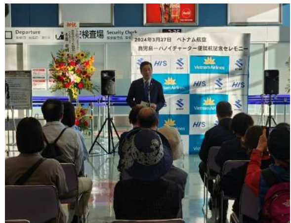
▲시오다지사가 인사하는 모습