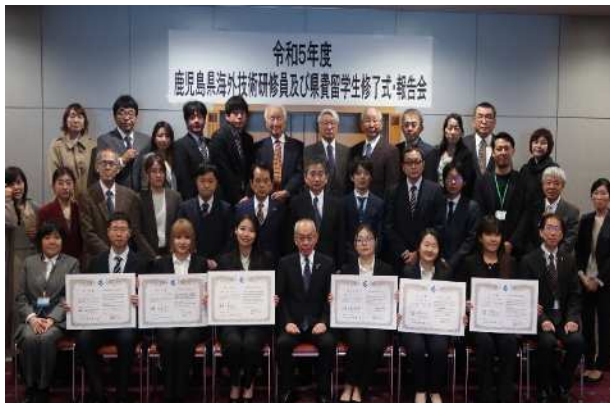
인사하는 현비 유학생들▶

당일 수입기관과 대학 이외에도 숙박시설이나 홈스테이 관계자 등 지원을 주신 많은 분들이 참석하셨습니다. 귀국 후에도 가고시마에서 배운 기술이나 지식, 경험으로 모국의 발전에 기여하고 모국과 가고시마의 징검다리가 되어줄 것을 기대하고 있겠습니다.