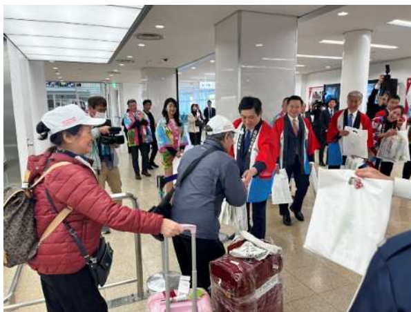
▲시오다지사가 베트남에서 가고시마에 오신 분들을 환영하는 모습