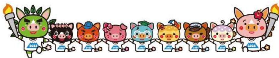
鹿儿岛县吉祥物：ぐりぶ一家族

此次大会原定于2020年举办，但受到新冠疫情的影响，时隔3年后，决定举办特别国民体育大会和特别全国残疾人运动会。