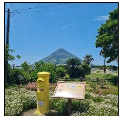
JR 日本最南端の西大山站！

车展前也有“幸福之钟”，旁边立着代表指宿菜花黄色的邮筒。邮筒也被称为“传递幸福的邮筒”。大家如果有机会去西大山站，不如去敲一下钟，给重要的人寄封信吧？