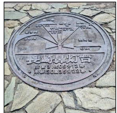
从长崎鼻可以看到的岛屿

我很惊讶，可以隐约看见屋久岛的身影！今年 1 月我去了屋久岛，当时乘坐高速船 TOPPY，感觉距离相当远，没想到从本土还能看到屋久岛！