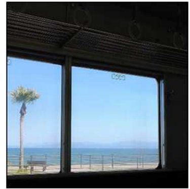
指宿枕崎线的风景

然后，在长崎鼻最近的西大山站下了车，但西大山站不是普通的车站。是JR日本最南端的车站！被称作萨摩富士山的开闻岳为背景，出乎意料竟然是个低调谦虚的地方。这是一条单线轨道，站台上仅有3个座位，如果错过电车，有时候需要等2-3小时。但是，我觉得这才是有魅力的地方。