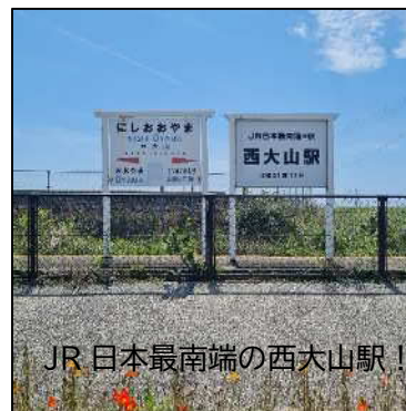
JR 日本最南端の西大山駅！