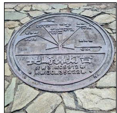
長崎鼻から見える島々

驚きましたが、屋久島の姿がぼんやりと見えていました！今年1月に屋久島に行きましたが、当時はトッピーで渡り、距離がかなりあると感じました。本土から屋久島が見えるとは思いませんでした！