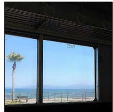
指宿枕崎線の景色

そして、長崎鼻の最寄り駅、西大山駅で降りましたが、西大山駅は普通の駅ではありません。JR日本最南端の駅です！薩摩の富士山とも呼ばれる開聞岳を背景に、意外と謙虚な場所でした。単線の線路で、ホームにはわずか3個の席が設置されており、電車を乗り遅れると2～3時間待たないといけないときもあるようです。でも、これこそ魅力的な場所だと思いました。