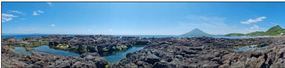
灯台の後ろにある岩礁

そして、岩礁の先端に立ち、水平線まで続く海を眺めながら、不思議なことに気づきました。