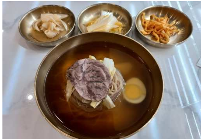
北朝鲜出身的知名厨师制作的 平壤冷面的味道太棒了！

韩国冷面的发祥地在北朝鲜平壤市和咸兴市。平壤冷面是用荞麦粉和少量淀粉揉成面条，加入鸡汤、萝卜泡菜、肉、梨、白煮蛋等制成的水冷面。另外，咸兴冷面是用当地盛产的土豆淀粉制作面条，在面条上放上调味过的比目鱼、鳕鱼等鱼的刺身，然后拌在一起的拌冷面。