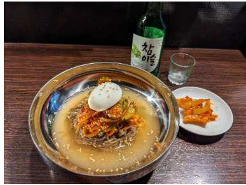
在鹿儿岛市内吃的咸兴冷面

这次我们介绍了韩国冷面！大家也来一份韩国冷面怎么样？我想一定能赶走夏日的炎热，度过一个凉爽舒适的夏天。