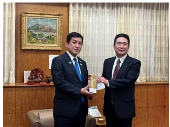
左：盐田知事 / 右：律桂军总领