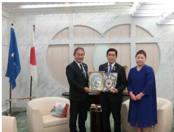
左边：大使 / 中间：知事 / 右：大使夫人