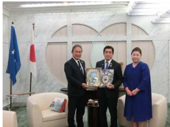
左:大使 / 中央:知事 / 右:大使夫人