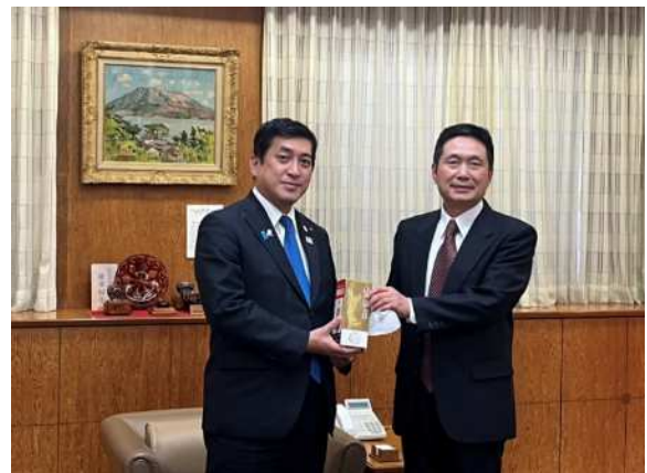
左:塩田知事 / 右:律桂軍総領事