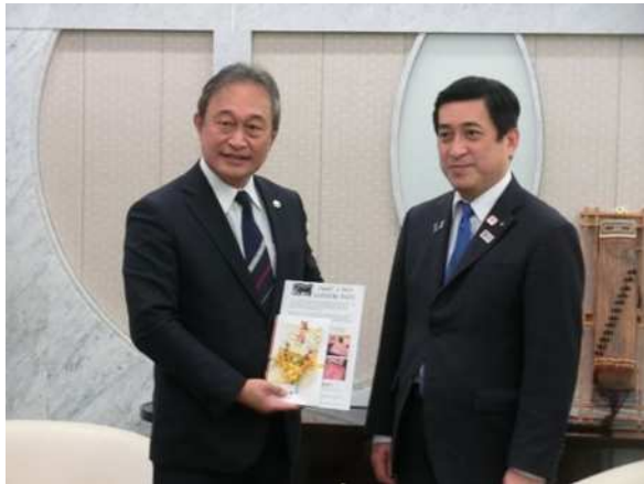
左:ジョン・フリッツ大使 / 右:塩田知事

知事からは、屋久島などミクロネシア連邦と同じ島々の話や、鹿児島が誇る豊かな食を紹介しました。また、鹿児島での太平洋・島サミットの開催を期待しながら、引き続きミクロネシア連邦との交流を進めていきたいとお話しました。