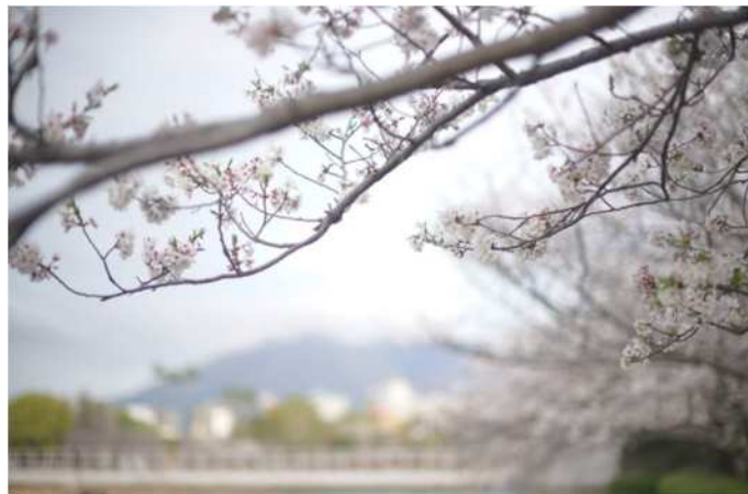
【春天】鹿儿岛市的樱花（樱岛）