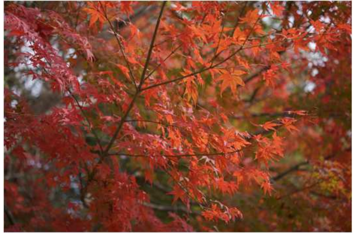
【秋天】雾岛市的红叶

据说在秋季，早晚温差变化越大，红叶越漂亮。但是，我每天在烦恼如何应对这巨大的温差。