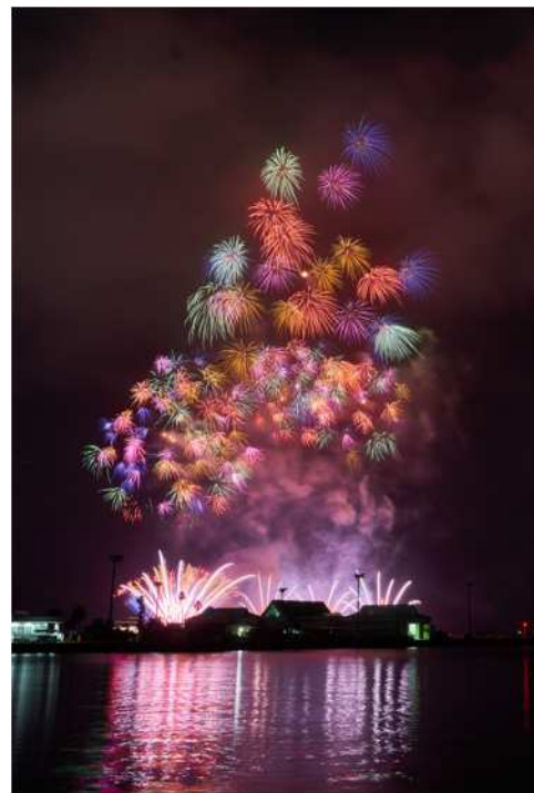
【夏天】鹿儿岛市的花火大会