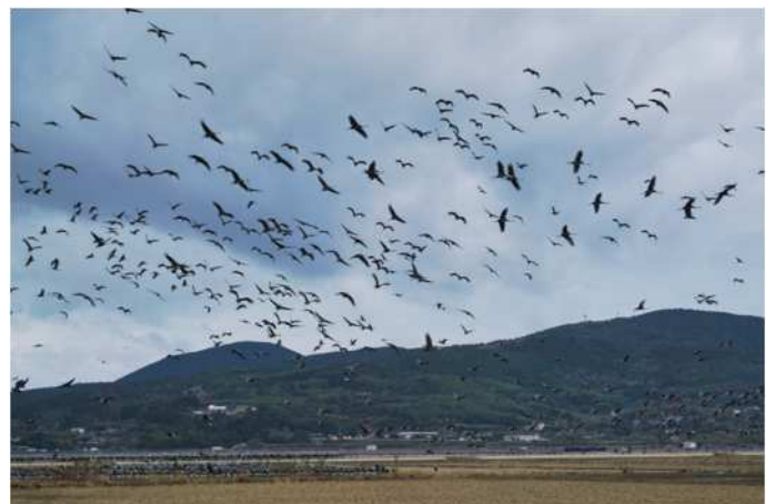
【冬】出水市に渡来するツル

一方、冬の寒さにも良い点がありました。寒さのおかげで虫やカビがほとんど発生しないのです！高温多湿の気候であるシンガポールでは、虫やカビへの対策が日常となっていたため、冬にその対策をしなくてよいのはとても助かりました。