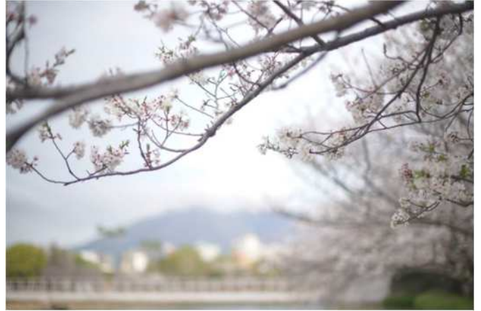
【春】鹿児島市の桜（と桜島）

来年の春はこの経験を活かして、冬から春に変わっていく小さな変化を見逃さないように過ごしたいと思います。