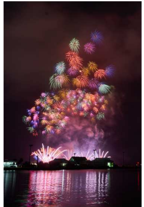
【夏】鹿児島市の花火大会

日本では、このように季節のサイクルが続いており、春夏秋冬は正に「人生における不変のものとは、すなわち変化である」というコンセプトを適切に示しています。永遠に続く季節はありません。「やっと慣れた!」と思ったら、すぐ次の季節がやってきます。