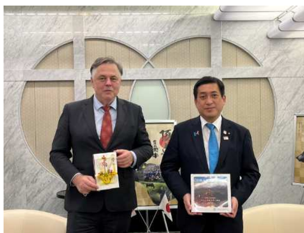
左：トムチョ大使/右：塩田知事