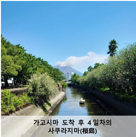
가고시마 도착 후 4일차의 사쿠라지마(桜島)

4개월 후, 기대감과 긴장감을 가진 채 저는 마침내 가고시마에 도착했습니다. 아직 2개월밖에 지나지는 않았지만, 이곳은 저에게 딱 안성맞춤이라는 생각이 듭니다. 이번 첫 칼럼에서는 제가 느낀 가고시마의 첫인상에 대해 여러분께 말씀드리고자 합니다.