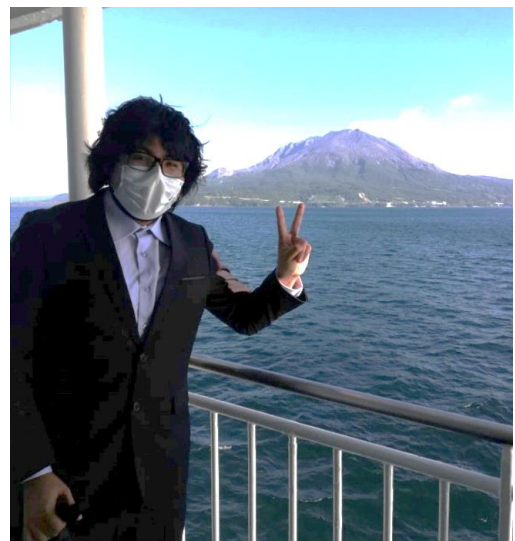
다루미즈(垂水) 페리에서 바라본 사쿠라지마(桜島)