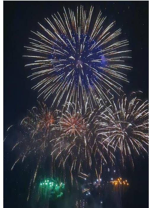
사쿠라지마에서 열린 「불의 섬 축제」의 불꽃놀이

그렇지만 지금까지의 생활은 정말 훌륭한 경험이었으며, 앞으로의 생활도 기대가 됩니다. 가고시마의 절경과 맛있는 먹거리도 물론이지만, 무엇보다도 가고시마 사람들의 상냥함과 따뜻한 환대가 가장 인상에 남습니다. 시로야마(城山) 전망대에서 가고시마의 역사에 대해 30분 동안 정성껏 설명해 주신 분, 교통 카드를 잘못 사용한 저에게 웃는 얼굴로 대해 주신 운전기사님, 그리고 따뜻하게 맞아주신 새로운 동료들과 친구들에게도 진심으로 감사드립니다.