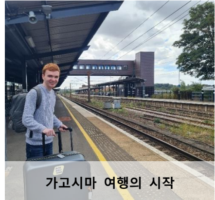
가고시마 여행의 시작

가고시마현에 부임하게 된 것을 처음으로 알았을 때를 지금도 선명하게 기억하고 있습니다. 국제교류원은 일본에서의 부임지를 본인이 결정할 수는 없지만, 저는 함께 갈 아내와 함께 내심 규슈를 기대하고 있었습니다. 그런 저에게 부임지가 가고시마라는 이야기는 정말 큰 기쁨이었습니다.