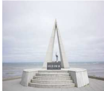
(上次的旅行) 北海道稚内本土最北端的纪念碑