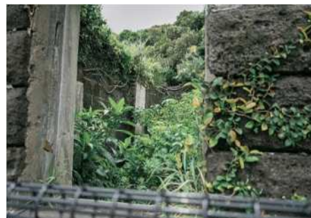
佐多岬灯塔看守的宿舍旧址