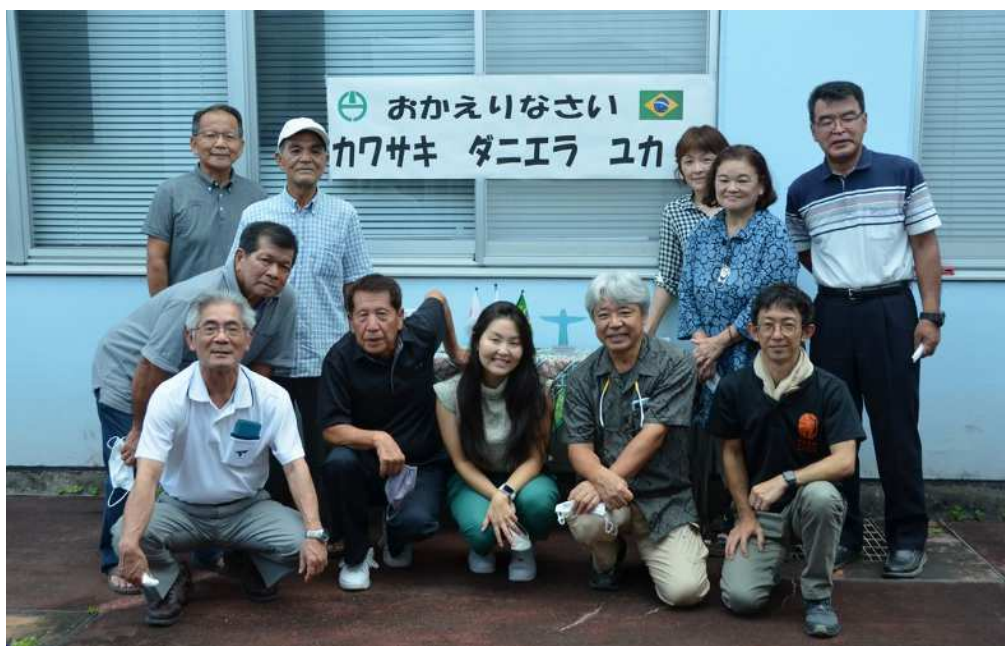
宇检村各位的热情欢迎！

回顾这次旅行，在这么短的时间里见到了这么多的人，所有人都非常友好亲切，真没想到大家会这样热情。我期待总有一天我要再去拜访奄美，再去和大家相会，来感恩和报答各位。真的非常感谢。