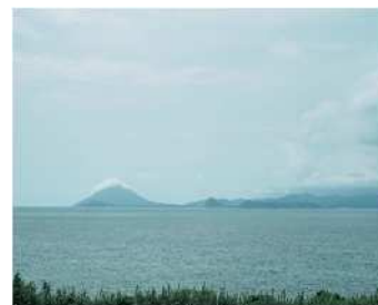
被云遮盖的开闻岳