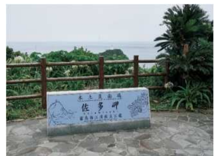
本土最南端の佐多岬