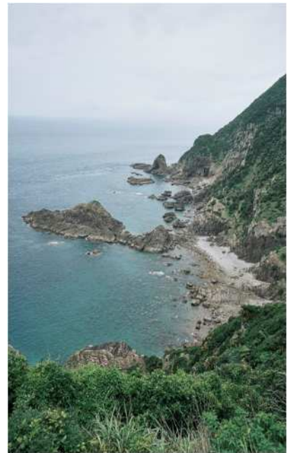
如果是晴天，展望台的背面可以眺望指宿的