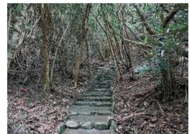
通往佐多岬灯塔宿舍旧址的石阶

这是一座周围植物生长茂盛、拥有独特南国风的历史建筑。现在虽只保留了外墙一部分，但在文化和历史上有着及其重要的存在。