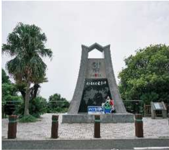
鹿儿岛南大隅本土最南端的纪念碑

一个是被温暖的亚热带所包围，布满绿意盎然热带林的最南端；一个是冷风呼啸的亚寒带，望眼辽阔的土地和平缓丘陵的最北端，两者让我感觉到它们都远离日本中心，都有着其独特的荒凉感。