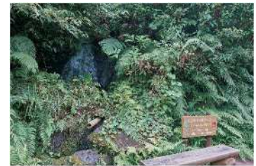
前往瀑布途中的天然冷气点