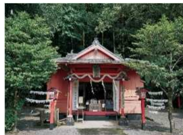
途中探访了全国罕见的鸟居并列的諏访神社