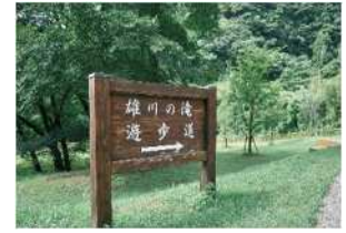
前往瀑布的散步道

到了雄川瀑布，壮观的景色映入眼帘。那天不是平常温和的瀑布，而是有巨量水流形成轰鸣声的瀑布。而且，由于水和光的完美结合，还看到了美丽的彩虹！