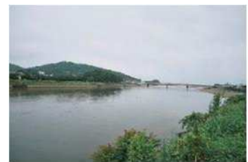
毎年、「ドラゴンボートフェスティバル」が開催される雄川

500年経った現在、周りの風景は大きく変わりました。交易船ではなく、代わりにドラゴンボートが走ります。毎年「ドラゴンボートフェスティバル」では、雄川の河口380メートルを競います。しかし、樹齢千年を越す南蛮船係留の大クスは変わらずにその町を見守っています。