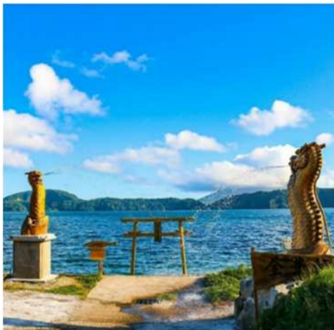
竜の口からは水が！