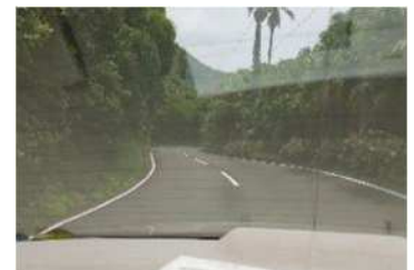
熱帯国みたいな佐多岬への道

薬園にはリュウガン、レイシ、オオバゴムノキ、アカテツ、ガジュマル等があって、全部日本ではあまり見ない植物です。私たちが行ったときはちょうどレイシの時期だったので、真っ赤なレイシをあちこちに見ることができました。