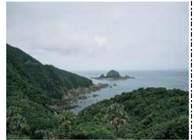
岬への歩道と周りの景色