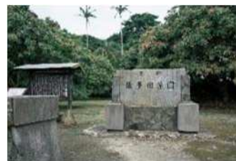
佐多旧薬園とレイシ

そのあと、近くの佐多旧薬園にも行きました。旧島津藩の薬園跡で、いろいろな珍しい植物・薬草が栽培された場所です。