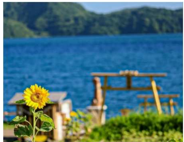
太陽を浴びるひまわり