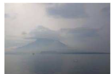
大隅へ出発する時に通り過ぎた、朝の霧に包まれている桜島