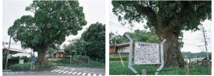
塩入橋入口での南蛮船係留の大クス

500年ほど前、この辺りは天然の良港であり、唐や琉球、東南アジアなどからの交易船がよく来ていました。その際、このクスノキ（大クス）に舳網を繋いだのだと言われており、樹名の由来となったようです。