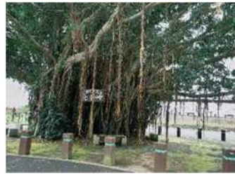
入口にある壮大なガジュマル

次は本番の佐多岬へ！片側に青い海が輝いて、ピロウやソテツなどの熱帯植物が並んでいる道を通りました。熱帯の国から来た私にとっては意外な懐かしい感じがしました。