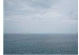
佐多岬展望台で見た 無限に広がる水平線

残念ながらこの日はちょっと曇っており、屋久島や種子島までは見えませんが、その壮大な景色、柔らかな海風と落ち着く波音で心が癒やされました。