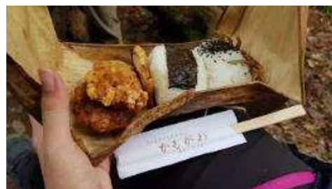
在鲜绿色的森林中品尝美味的饭团炸鸡块便当