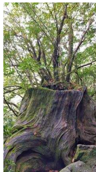
在一代杉树上长出的二代杉树