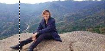
不敢相信我竟然登顶了

在那里还能欣赏到包括屋久岛奥岳这样壮丽的景色。多亏天气好，还看到了九州最高峰宫之浦岳和安房川的绝景。