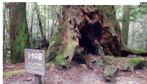
为了纪念屋久岛登录世界遗产20周年，小学生用可爱丰富的想象力给杉树取名字