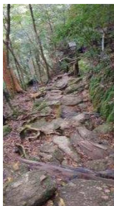
江户时代砍伐屋久杉人使用的楠川道路