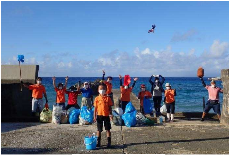
海謝美の活動風景