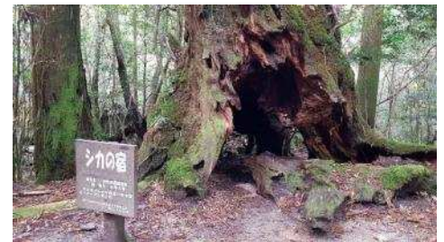
屋久島世界遺産 20 周年記念のため、小学生がかわいい想像力豊かな名前を付けた杉の一つ