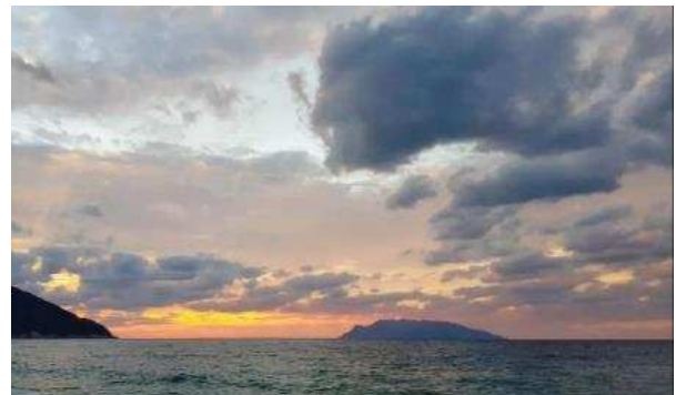
オオカミ(?)に見える