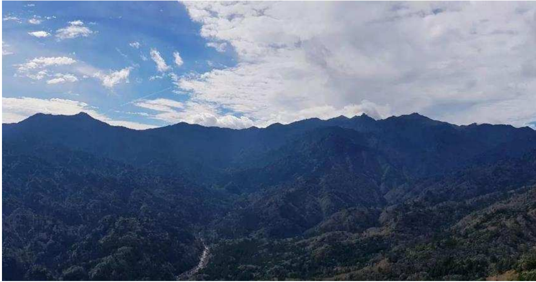
太鼓岩からの眺め

そこでは屋久島の奥岳を含めて壮大な景色が楽しめます。良い天気のおかげで九州最高峰の宮之浦岳と安房川までの絶景も見えました。