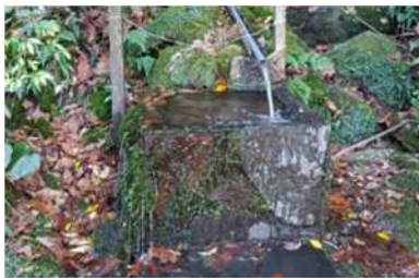
柔らかい美味しい湧き水

ここから離れたくないほどの風景でしたが、そろそろ戻る時間になりました。(私にとっての) 厳しいハイキングコースで足が棒になったけど全く後悔がなかったです。そして私のペースに合わせてくれたみなさんにまた感謝の気持ちしかありません！