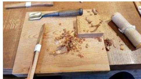
鑿(のみ)で削って、茅(かや)の根っこを束ねたもので磨く

作業をしながら、先生も地元の興味深い話と歴史を話してくれました。すごく面白かったです！