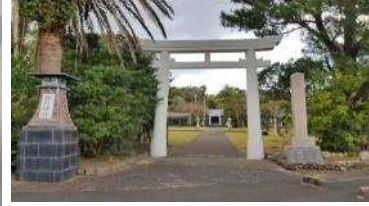
古い時代から屋久島と隣の種子島の人々を守る益救神社

時間はあっという間に過ぎ、いつのまにか旅の終わりを迎えました。雨が多いことで有名な屋久島なのですが、3日間とも幸運の晴れで本当に良かったです。