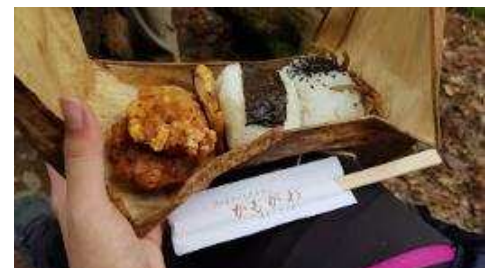
鮮やかな緑の森の中に美味しいおにぎり と唐揚げのお弁当