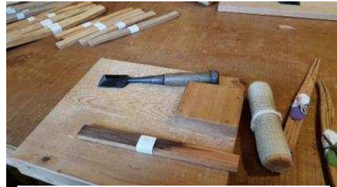
千年のきれいな屋久杉素材

自分の好きな屋久杉素材を選んだら、職人の先生は江戸時代以来ずっと使われている道具や方法で杉の木から箸の作り方を教えてくれました。