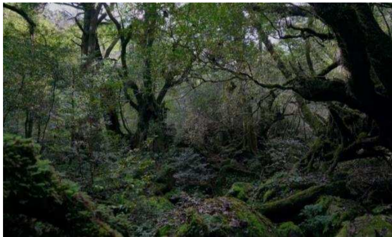
苔むす森（通称もののけ姫の森）