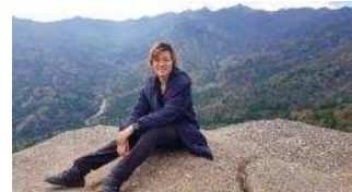
頂上に登ってきたなんて信じられない私