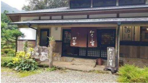
「杉の舎」での「仙人さんの箸づくり体験」

三日目の朝、みんなと一緒に箸づくり体験に参加するチャンスがありました。これは千年の屋久杉素材を削って箸を作る体験です。手芸に興味を持つ私は大喜び！