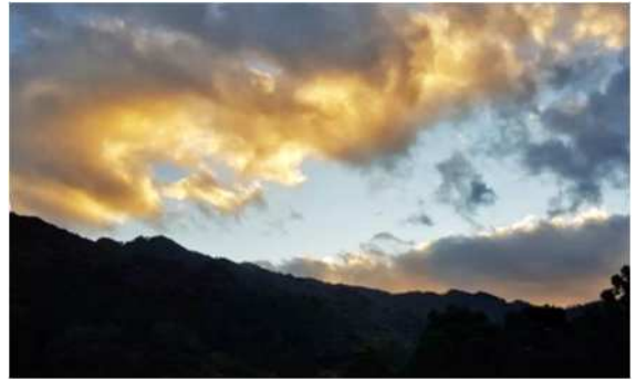
夕暮れの色で塗られた空

それからは屋久島の有名な滝に行く予定でしたが、結局ハイキングに時間がかかりすぎてしまって夕暮れまであと一つの所しかいけませんでした。すごく残念ですが、次に到着した浜の穏やかな美しさですぐに気分転換しました。