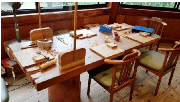
温かな空気感と杉の香りを持つ木製施設で行った箸づくり体験