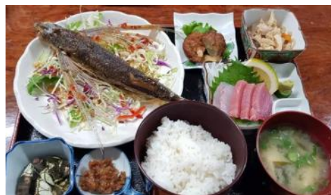
店「あわほ」での「トビウオ飛んだ定食」は美味しいし、名前もかわいい！

次は屋久島での最初の食事、地元名物料理のトビウオ定食です。トビウオを食べるのは初めてで、味も外観もすごかったです。