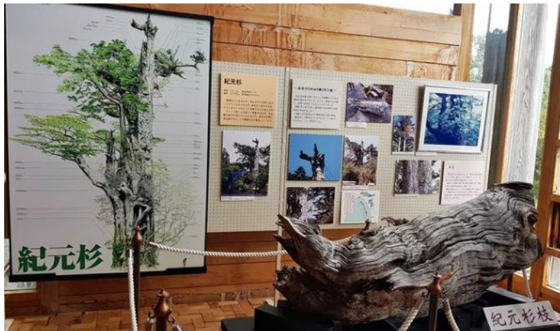
紀元杉の枝と着生植物の紹介

また、1本の屋久杉に多数の着生植物が生えていることも学びました。例えば、樹齢三千年の壮大な紀元杉だけで30種以上の植物が共存しています。