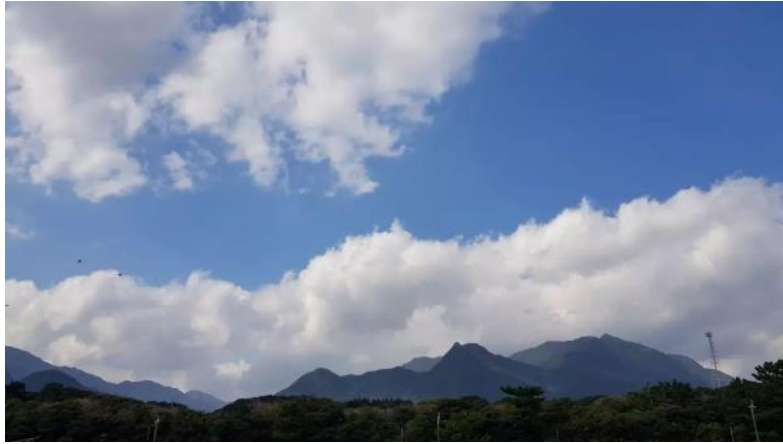
屋久島の美しい青い空