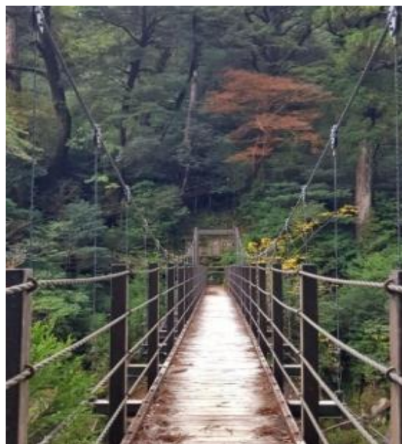
登山道がまだ楽だった頃の美しい吊り橋