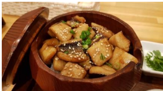
トビウオひつまぶし

夕食もおいしい郷土料理でした。今回は屋久島の特産トビウオのひつまぶしセットです。元々ウナギ料理のひつまぶしスタイルからトビウオでアレンジした食です。