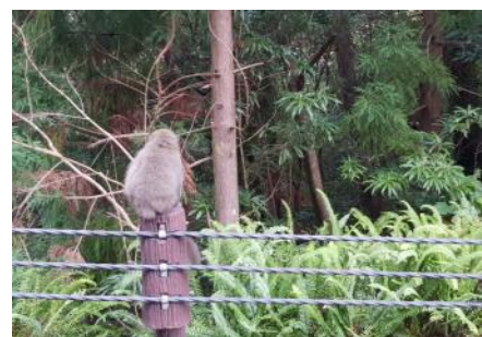
途中で見た2匹の鹿（ヤクシカ）と猿（ヤクサル）一家