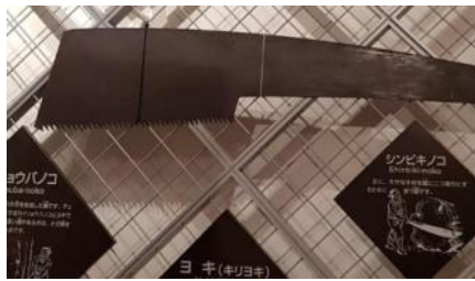
巨木用の巨大ノコギリ

輪切りにした巨大な円板も展示されて、数えきれない年輪は成長の遅い屋久杉の年齢がはっきりと分かりました。