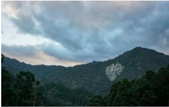
ハート形の地すべり傷跡

食後、山へ向かいました。フレンドリーな運転手さんに運転してもらって、豪華な空と山の風景を見ることができました。