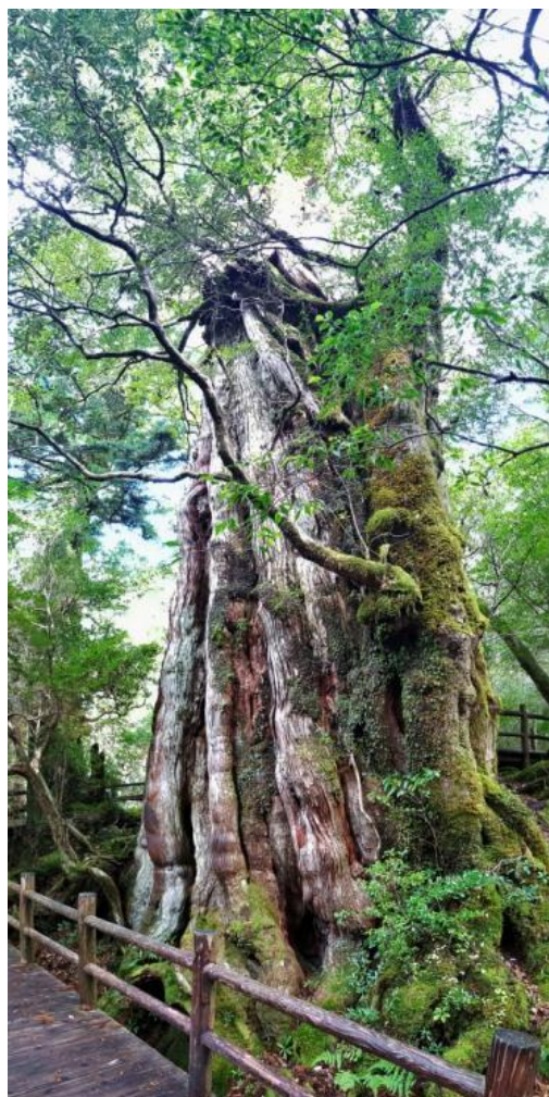
樹齡3千年の紀元杉