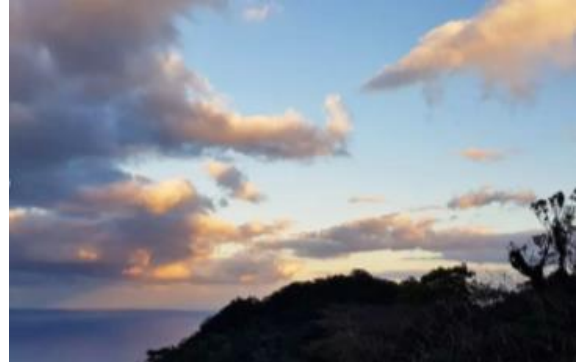
パステルカラーの空

九州最高峰の宮之浦岳がそびえたつ屋久島で、南の沖縄みたいな暖温帯から北の北海道みたいな冷温帯までの多様な植生がこの一つの島で成長していると教えてくれました。