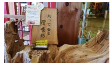
削って香る屋久杉の体験コーナー