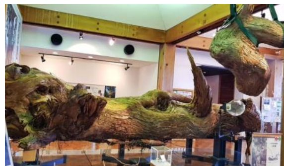
大雪の重さで折れた縄文杉の枝「いのちの枝」

屋久杉自然館は、屋久杉のすべてを知ることができる魅力的なところ です。江戸時代の人々が使った道具をはじめ、今の保護状態から屋久杉の 特徴までの展示や屋久杉に関する情報がたくさんあります。展示物を見 ながら、杉の香りが空間に浸透し、すごく心地よい体験でした。