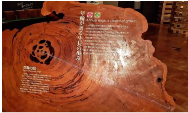
大きな円板にある古代からの年輪

また、1本の屋久杉に多数の着生植物が生えていることも学びました。例えば、樹齢三千年の壮大な紀元杉だけで30種以上の植物が共存しています。