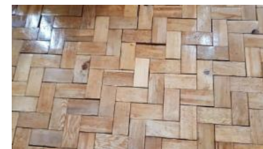
踏むといい音がする杉ブロックでできた床