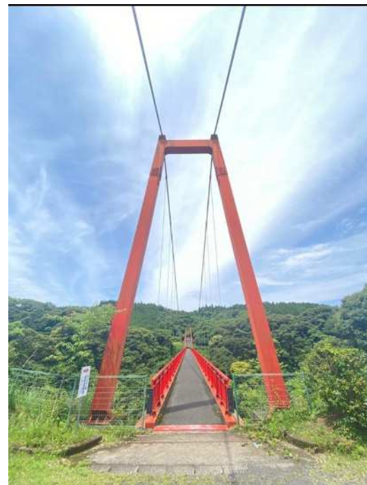
虹のつり橋大滝橋