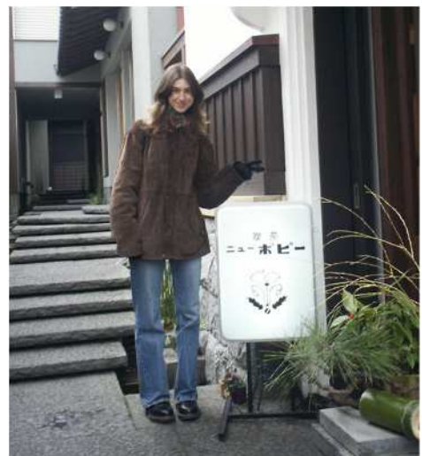
自分と同じ名前の喫茶店（名山堀）

鹿児島に配属される前，鹿児島のことを知らなかったのですが，毎日，鹿児島の文化，歴史や自然などについて学んでいるところです。鹿児島にいるのは，大変すてきなことです。