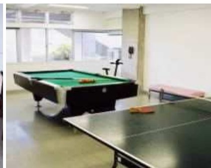
レクリエーション室