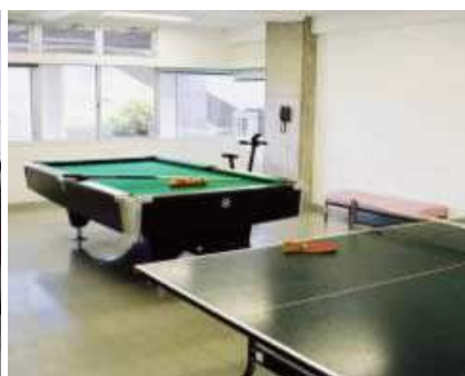
レクリエーション室