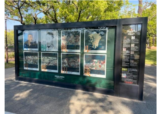
ドラマの道ARモニュメント