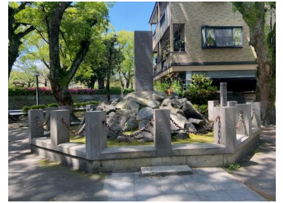
西郷隆盛生誕の地