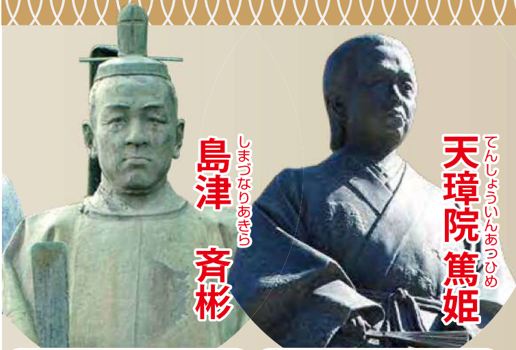
島津 斉彬 しまじなりあきひら