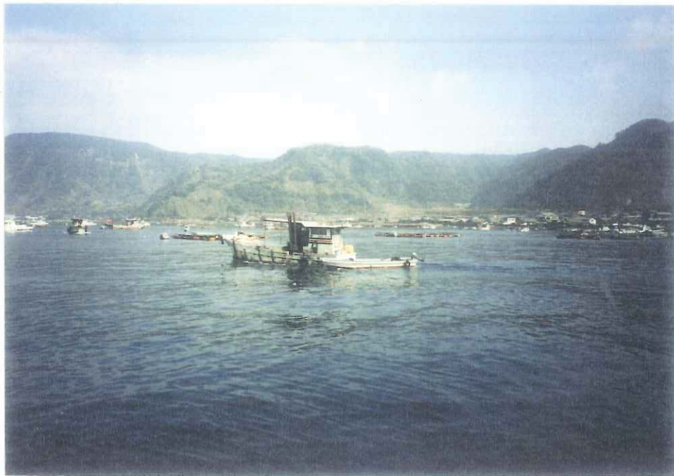
係船岸の不足により，多くの漁船が沖に停泊している 平成13年7月撮影