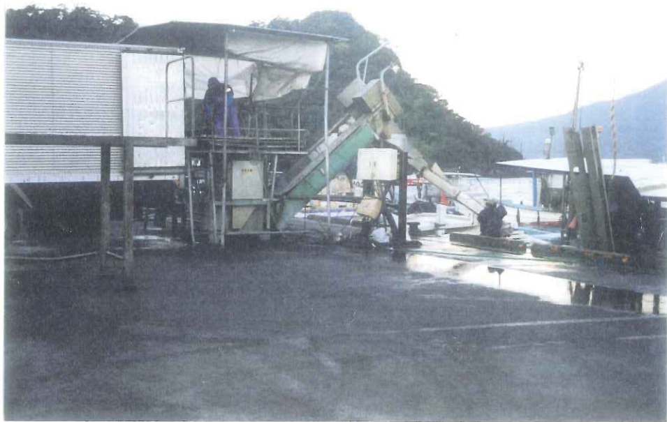
係船岸の不足により，養殖用餌の積込作業時に待ち時間が発生するなど効率が悪い。