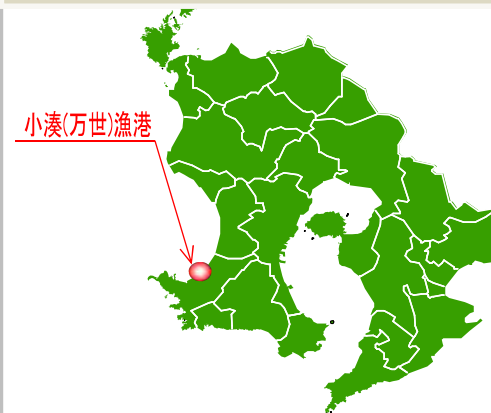
凡例（事業実施年度）