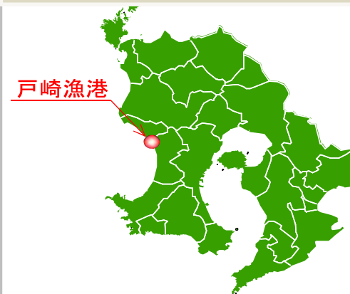
凡例（事業実施年度）