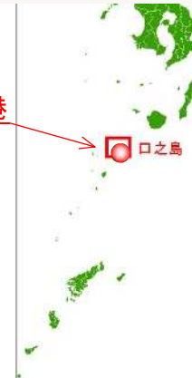
凡例（事業実施年度）