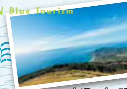
パノラマパーク西原台