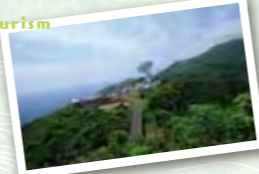
内之浦宇宙空間観測所