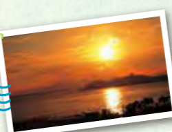
ダグリ海岸線夕日