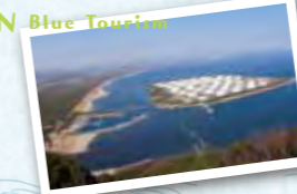
権現山からの眺望