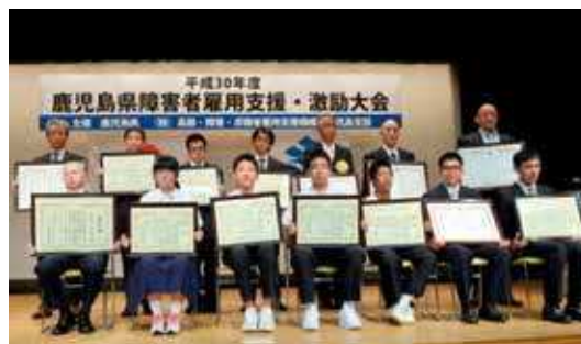
(障害者雇用支援・激励大会)