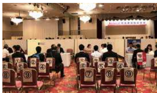
(障害者就職面接会)

【問合せ先】 県雇用労政課雇用支援係 ☎099-286-3028 鹿児島労働局職業対策課 ☎099-219-8712 (独)高齢・障害・求職者雇用支援機構鹿児島支部 ☎099-813-0132