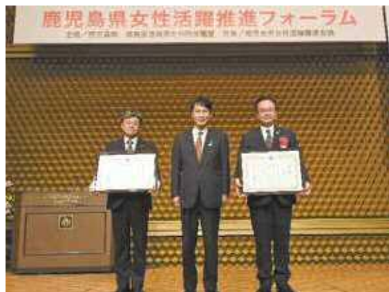
左から国立大学法人鹿児島大学、三反園知事、町田酒造株式会社