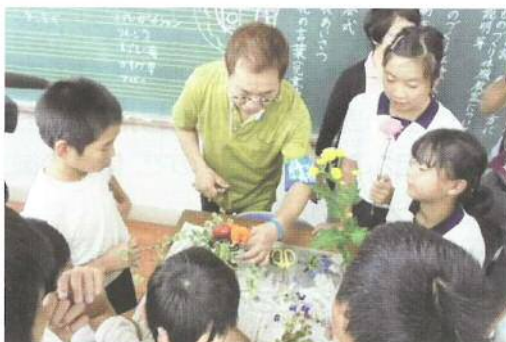
【フラワー装飾体験（森山小）】