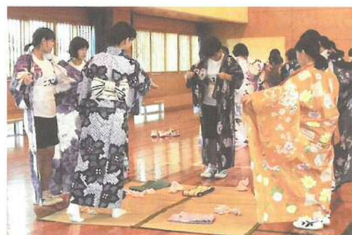
【和装体験（北指宿中）】