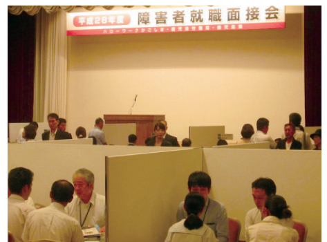
（障害者就職面接会）

【問合せ先】 県雇用労政課雇用支援係 ☎099-286-3028 鹿児島労働局職業対策課 ☎099-219-8712 (独) 高齢・障害・求職者雇用支援機構鹿児島支部 ☎099-813-0132