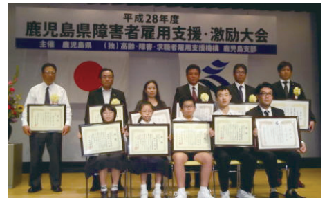
（障害者雇用支援・激励大会）