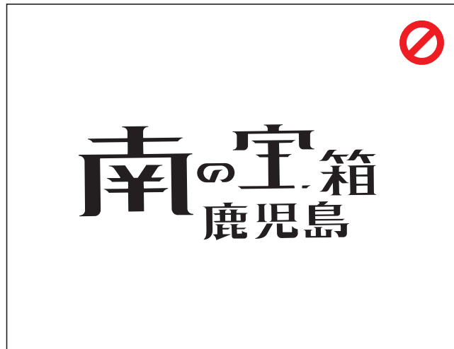
ロゴマークの一部が欠けた状態