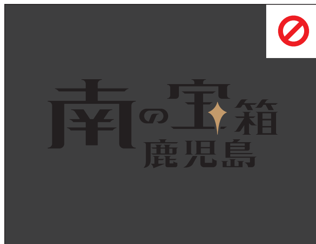
識別を損なう表示①