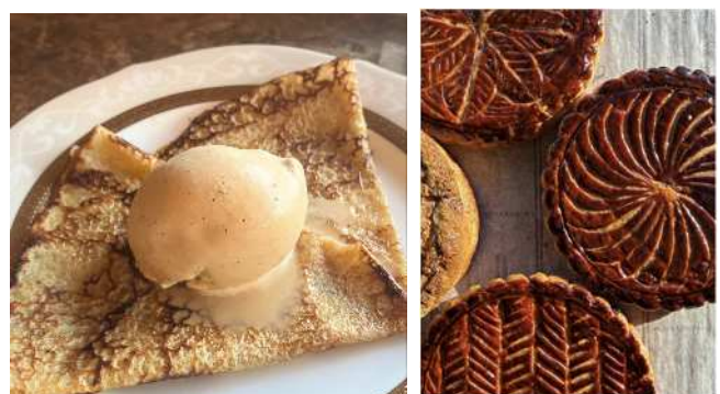
▲県外の先進店への視察を重ね、クレープやガレットなどの新商品の開発に取り組んだ