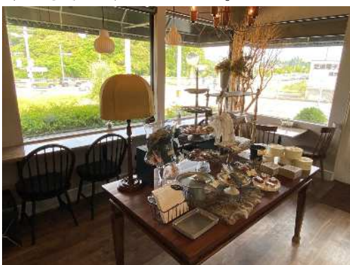
▲店内をゆったりと寛げる空間へと刷新した

まず、店舗をフランス風の格調ある外装・内装を備えた、ゆったりと寛げる空間へと刷新するとともに、クレープやガレットなどのサロン・ド・テ専用メニューを開発した。さらに、夏季には店内でワインや洋菓子などを楽しめる「夜ジャニス」を開催し、新たな顧客体験の創出にも取り組んでいる。