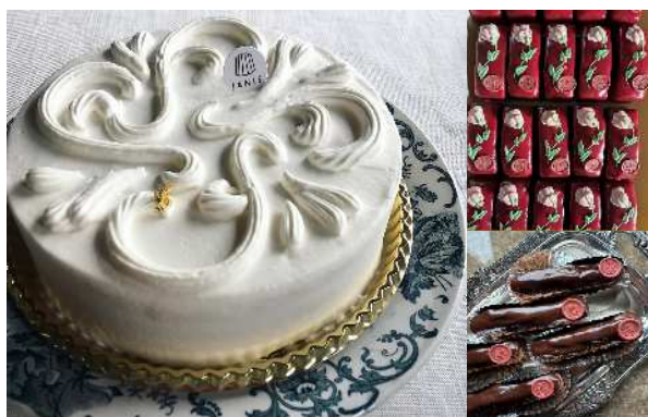
▲高級感あふれる見た目も美しいスイーツ

また、近年は海外からの来店客も増加していることから、今後はフランスをはじめとする海外展開も視野に入れている。そのため、ブランド価値の更なる向上を図り、地域に根ざしながら世界へ発信する「幸せを届ける洋菓子店」として確固たる地位を確立したい。