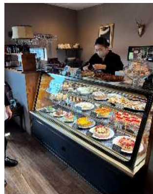
▲店内にはフランス伝統菓子や彩り豊かなケーキが並び