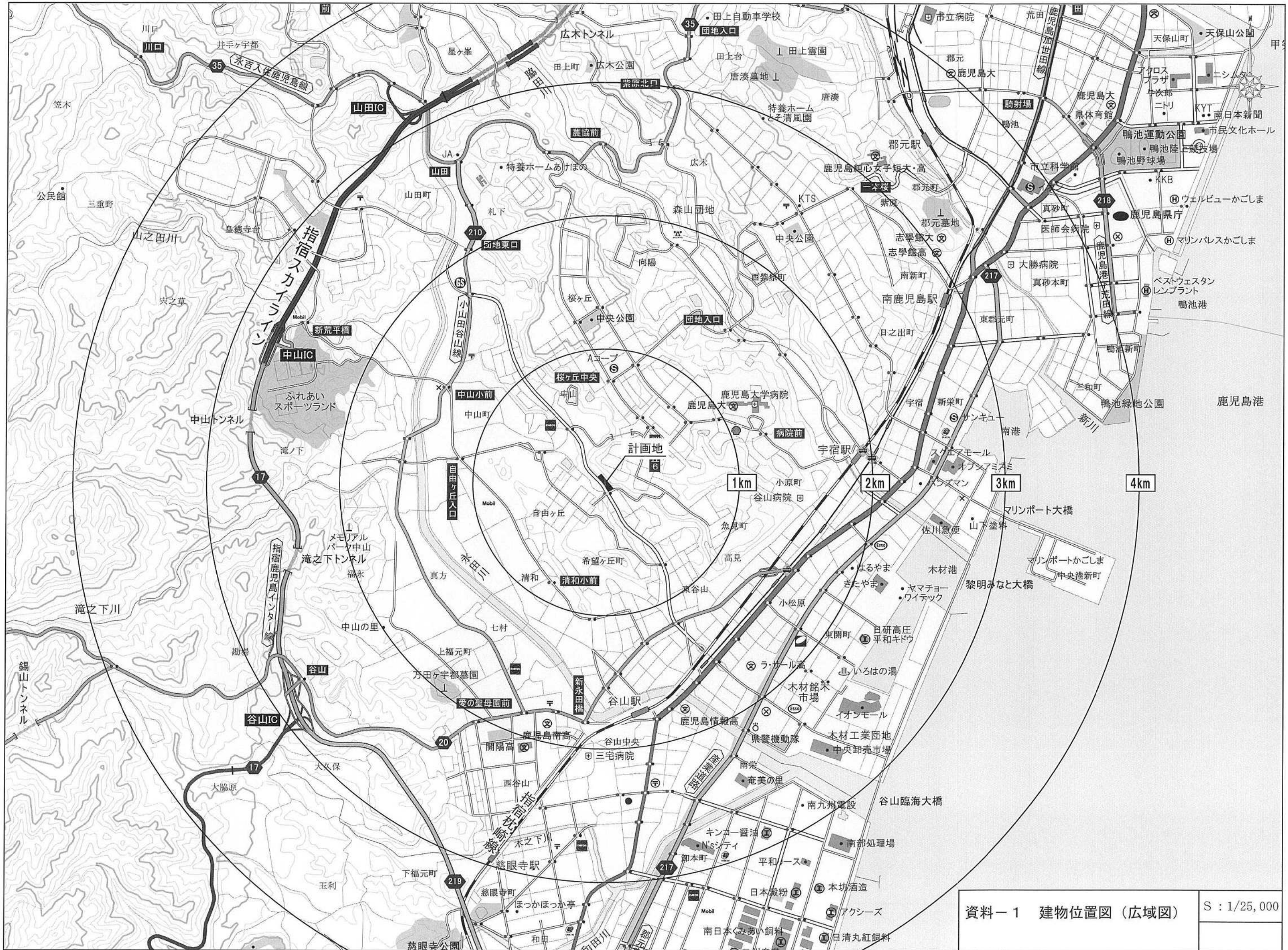
資料-1 建物位置図(広域図)